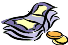
Investieren, aber auch haushalten