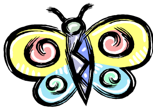
Flora und Fauna auch im Siedlungsgebiet