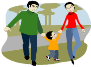
Ein attraktives Dorf für Familien