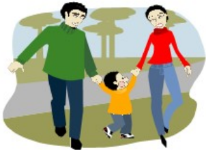
Ein attraktives Dorf für Familien