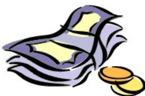
Investieren, aber auch haushalten